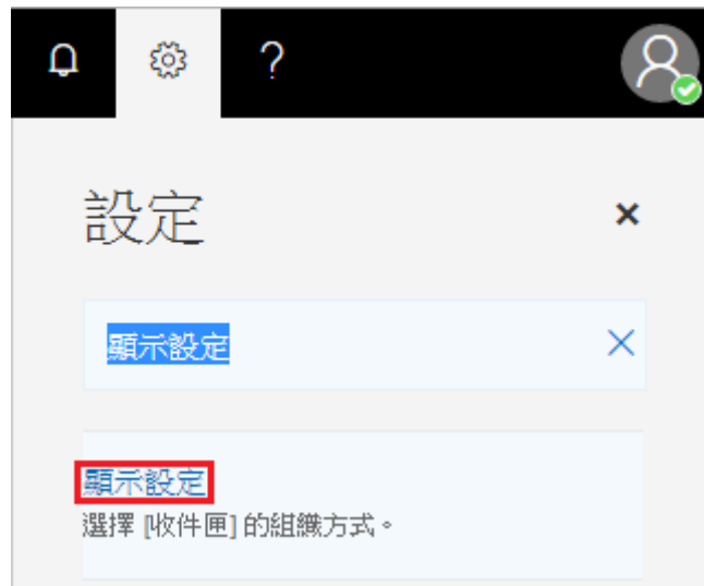
圖二：搜尋顯示設定