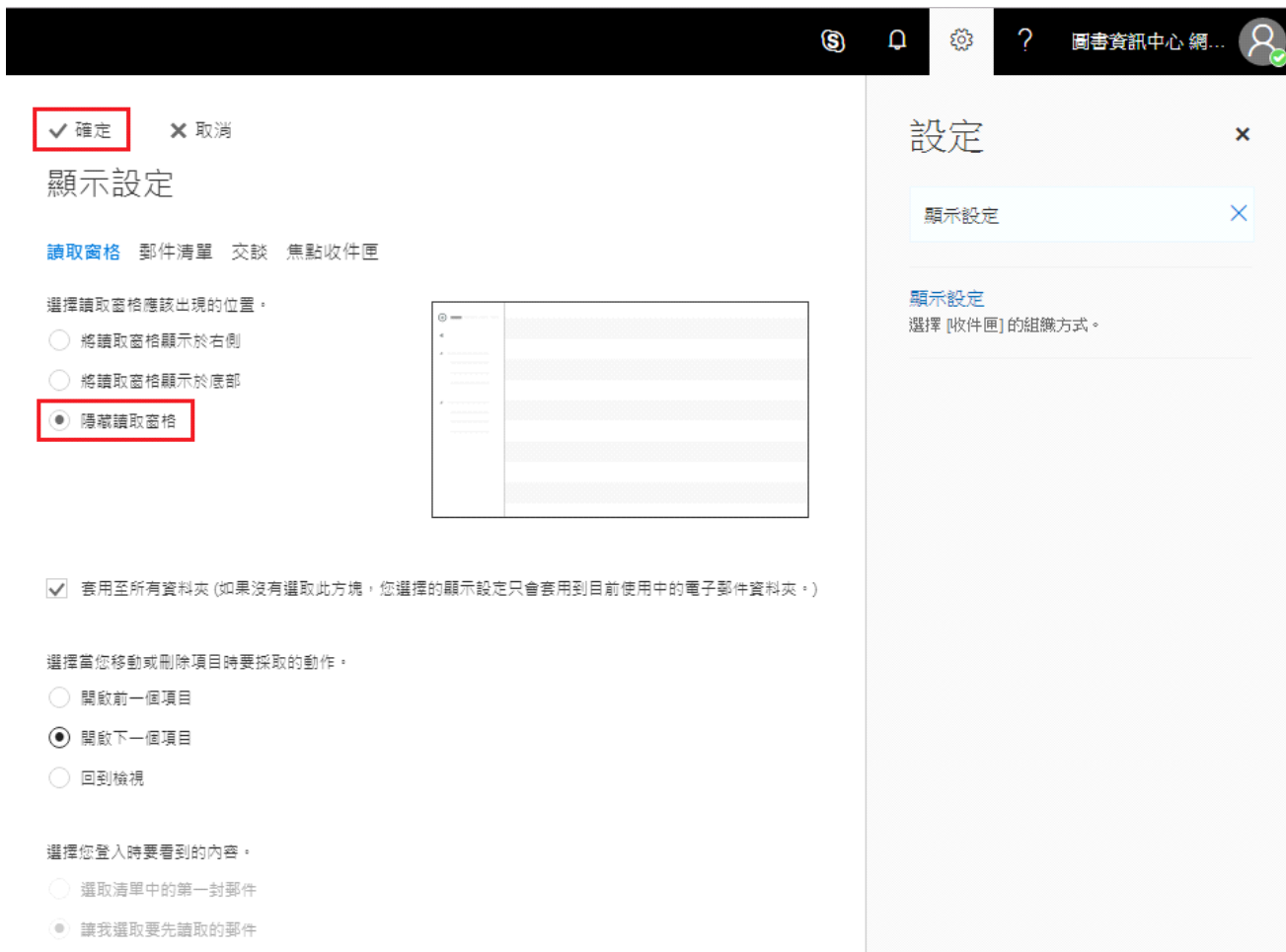
圖三：隱藏圖取視窗